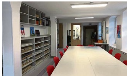
Die Malschule befindet sich im Massivbau und bietet viel Raum für Kreativität.