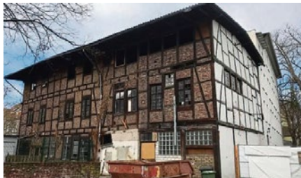
Diese Ansicht hatten die Handwerker, nachdem sie vor Beginn der eigentlichen Arbeiten zunächst das Laub und den Efeu entfernt hatten.