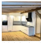
Dies ist eine der modernen Küchen, die im Fachwerkbau entstanden sind.