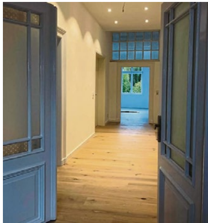
Durch eine Flügeltür kann man einen Blick in eine der kernsanierten Wohnungen im Massivbau werfen.