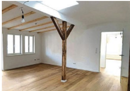
In dieser kernsanierten Wohnung im Fachwerkbau sind die Balken aus Fichte erhalten geblieben.