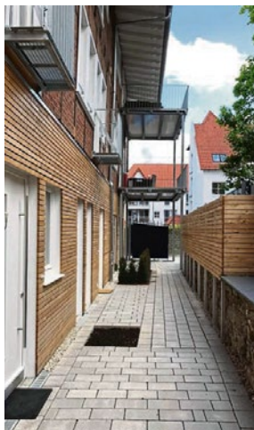
So sah der Zwischengang vor der Baumaßnahme aus.