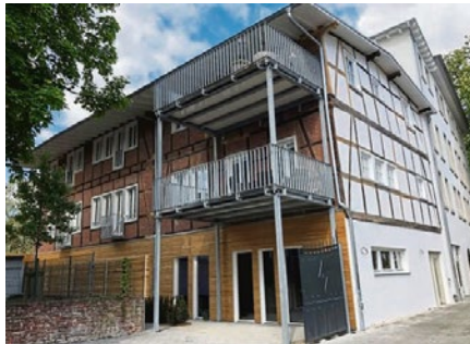
Der moderne Stahlbau an der Rückseite des denkmalgeschützten Gebäudes steht für sich. Er ist robust, daher sind beim Bau keinerlei Schäden an der Fassade entstanden.

Im vorderen Massivbau, in dem die Fachleute der Materio GmbH die Dachdeckerarbeiten, den Innenausbau und die Zimmerarbeiten übernommen haben, war eine zusätzliche Dämmung nicht nötig, denn die dicken Steinwände dort sind bis zu 60 Zentimeter stark und somit rund viermal so dick wie die Wände im Fachwerkbau, den die Experten der Zimmererei Müller saniert haben. Durch den Einbau eines Aufzugs in einem alten Lichtschacht sind die Wohn- und Gewerbeeinheiten nun größtenteils barrierefrei erschlossen. gb