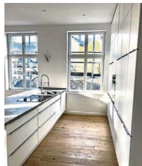
In dieser modernen Küche im Massivbau möchte man gleich locken.

Der ursprüngliche Baukörper in Form des vorderen Massivbaus ist von 1886, das rückwärtig angebaute Fachwerkgebäude von 1898. Im Jahr 1907 wurde der Massivbau seitlich mit einem vorspringenden Bau in angepasster Form erweitert. 1986 wurde das Objekt als Denkmal eingetragen. Das Gebäude war und ist ein Wohn- und Geschäftshaus und kann im Ursprung in die Zeit des Historismus (1840-1900) eingeordnet werden. In diesem Gebäude befanden sich ursprünglich die Produktion, die Ausstellung und der Verkauf eines Möbelhauses sowie eine private Wohnung. Zuletzt war dort neben einer Wohneinheit die frühere Kult-Kneipe „Anno“ ansässig.